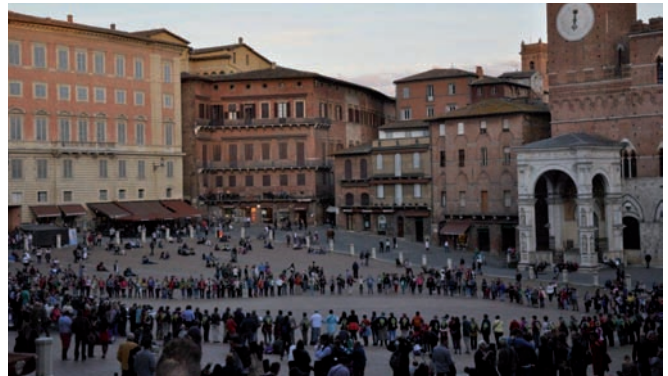
kfb-Frauen in Siena